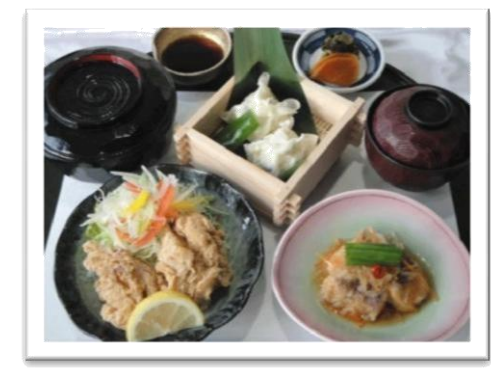
三味定食 (920 円)