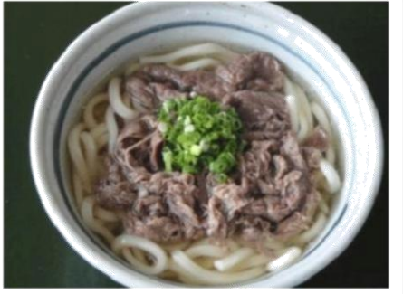
肉うどん (650 円)