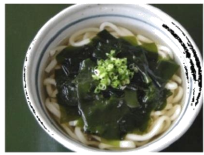
わかめうどん (500 円)