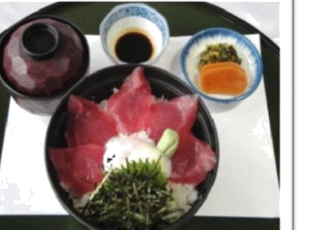
まぐろ丼 (740 円)