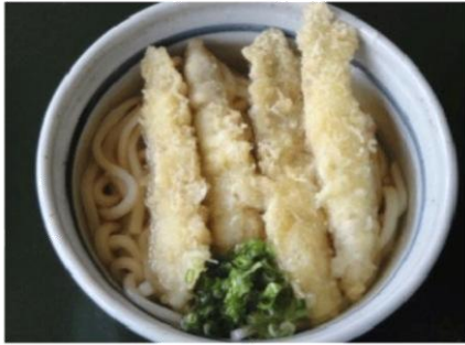
ごぼう天うどん (500 円)