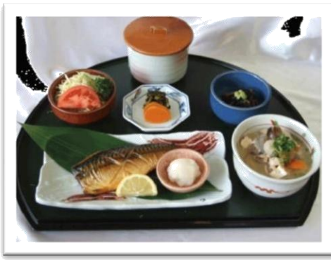
豚汁と焼魚定食 (890 円)