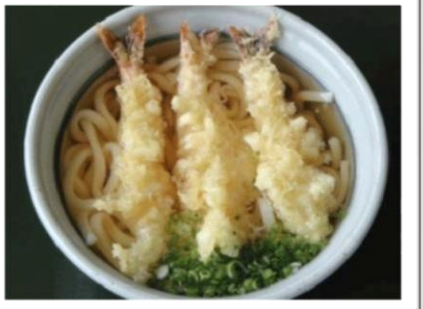
海老天うどん (590 円)