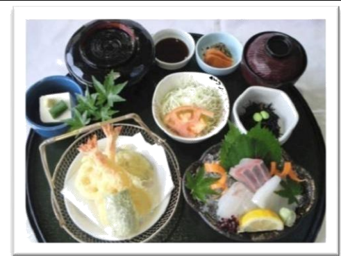
天刺し定食 (1,450 円)