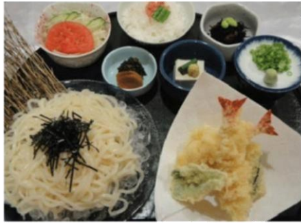
天ざる (うどん、そば) 定食 (920 円)