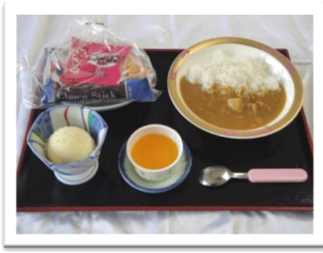
お子様カレー (600 円)