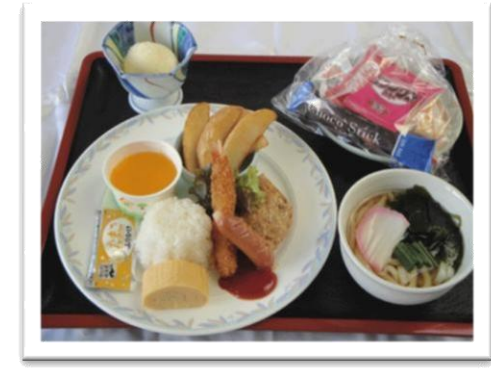
お子様セット (780 円)