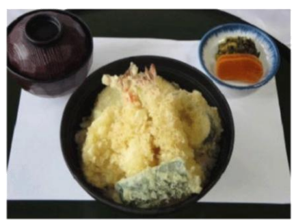
天井 (620 円)