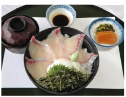
カンパチ丼 (770 円)