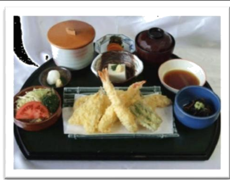
天ぷら定食 (1,080 円)