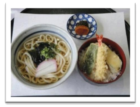
ミニ天丼セット (770 円)