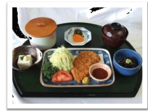
とんかつ定食 (890 円)