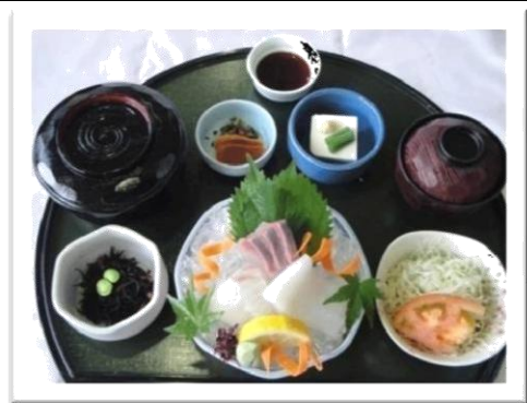
刺身定食 (1,000 円)