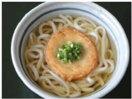
丸天うどん (500 円)