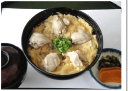
親子丼 (580 円)