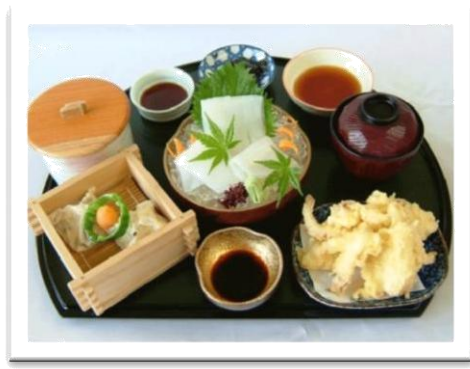
いかづくし定食 ( )