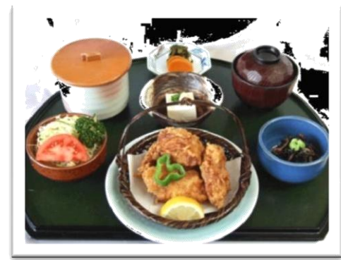
唐揚げ定食 (890 円)