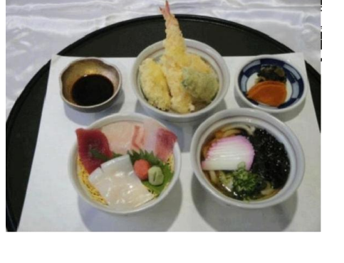
どんだん丼 (950 円)