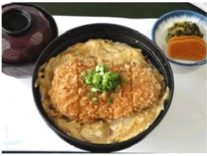
カツ丼 (620 円)